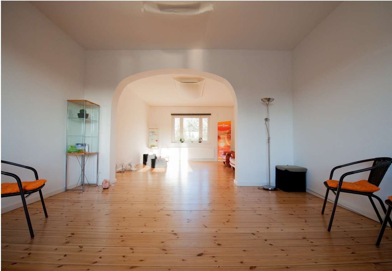
Abb. 1: Seminarraum 50 qm

Unser Ziel ist es, die Räumlichkeiten auf 135qm für viele verschiedene gesundheitsfördernde, entspannende und transformierende Seminare, Workshops oder Behandlungen zur Verfügung zu stellen. Ein Wohlfühlzentrum auf körperlicher, geistiger und seelischer Ebene. Hier darf sich jeder selbst erfahren, Kraft tanken, Spaß haben und neue Erfahrungen sammeln.