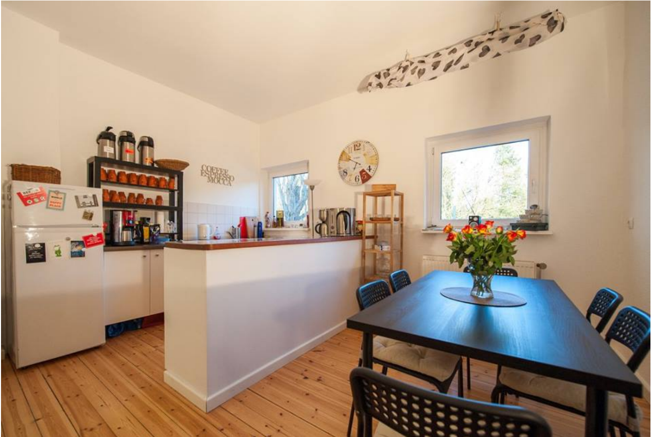
Abb. 2: Küche

Im Preis inbegriffen ist die Nutzung der geräumigen, voll ausgestatteten Küche. Sie finden hier: Espressovollautomat, Kaffeemaschine, Wasserkocher, Wasserfilter, Karaffen (z.T. für restrukturiertes Wasser), (große Pump-)Thermoskannen, Herd, Kühlschrank, Spülmaschine, div. Geschirr und Besteck (darunter Tassen, Gläser, Sektgäser, tiefe und flache Teller, Teller und Schüsseln zum Anrichten), Waschmaschine.